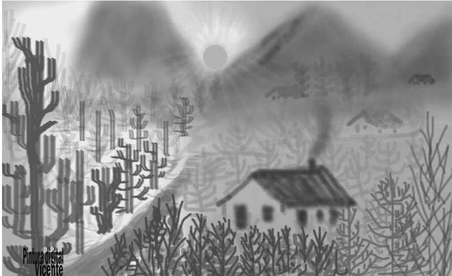
[Visão do Sertão - Vicente Itabaiana]