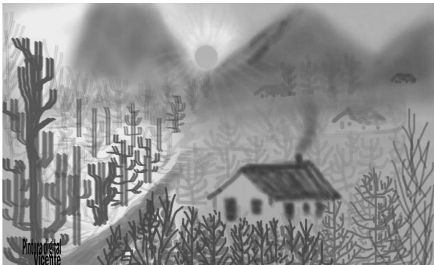
[Visão do Sertão - Vicente Itabaiana]