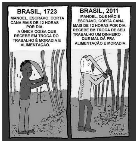
Sem autor indicado. Imagem – texto. Escravidão. Extraído de publicações em redes sociais – facebook, acesso em 12 de janeiro de 2012.